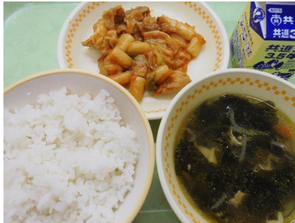
ごはん・トッポギ入りタッカルビ わかめスープ・牛乳