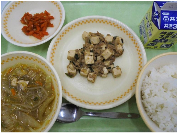
ごはん・麻婆豆腐 にんじんのオイスターソース炒め 中華スープ・牛乳 A献立 10日・B献立 11日