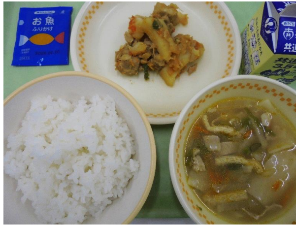
ごはん・ふりかけ 鶏肉とじゃがいもの味噌炒め ひつまみ汁・牛乳 A献立 21日・B献立 22日