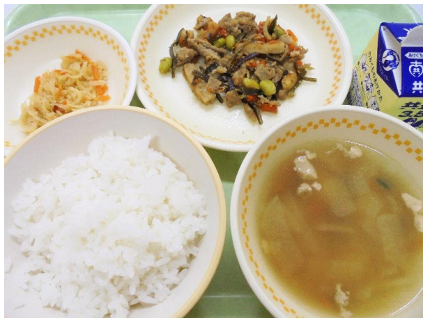
ごはん・豚肉と昆布の炒め煮 切干大根のはりはり漬け じゃがもちのすまし汁・牛乳 A献立 30日・B献立 28日