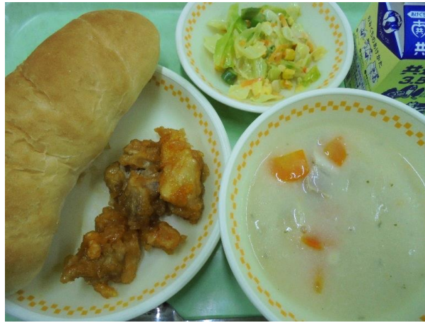
パン・鶏肉のスイートチリソース アスパラガスのサラダ・ソイチャウダー・牛乳 A献立 11日・B献立 10日