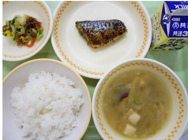
ごはん・鯖のごまだれ焼き 白菜のおかか和え・味噌汁・牛乳