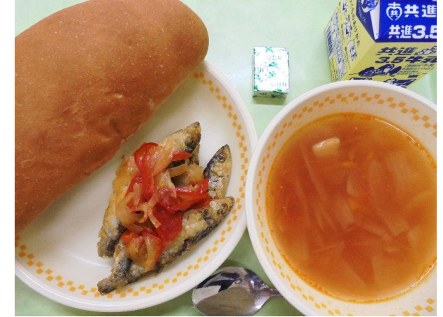
パン・鯖のエスカベッシュ・トマトアホスープ チーズ・牛乳