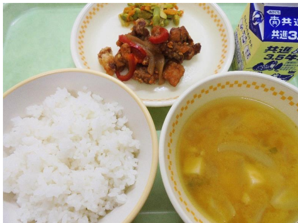
ごはん・揚げ豚のバーベキューソース 枝豆の炒め物・かぼちゃの味噌汁・牛乳