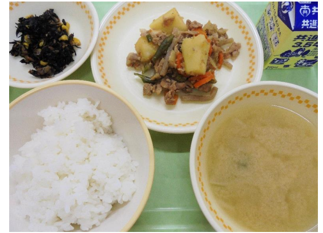
ごはん・肉じゃが・ひじきの炒め煮 大根の味噌汁・牛乳 A献立 14日・B献立 15日