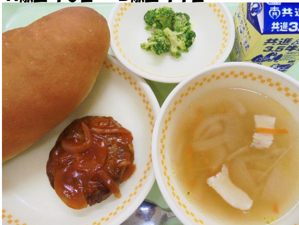
パン・ハンバーグ・ブロッコリー 玉ねぎスープ・牛乳 A献立 15日・B献立 14日