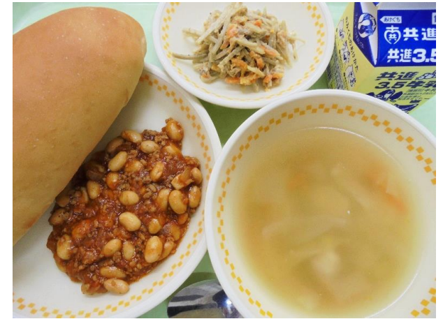
パン・チリコンカン・ごぼうサラダ 押し麦スープ・牛乳