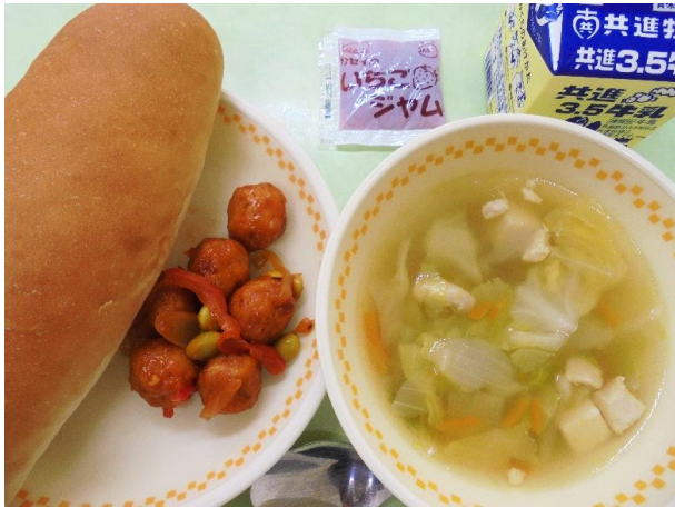
パン・いちごジャム・鮭ボールのオーロラ揚げ 春キャベツのスープ・牛乳