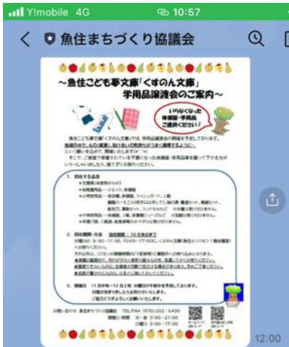
魚住まちづくり協議会 LINE 公式アカウント参照

一つ目は魚住まちづくり協議会さんの「魚住子ども夢文庫 “くすのん文庫”」で企画されている「学用品譲渡会」の案内です。不用になった体操服や学用品を地域の方に呼びかけて集め、必要な方に利用していただくという企画です。子どもが使っていたものだけに、なかなか捨てられないと保管されている方も、それを生きた形で使ってもらえたらと思われる方も多いのではと思います。こうした企画が地域の中で進んでいるんだとびっくりしました。こうした中で、新たなつながりが生まれてくるんでしょうね。