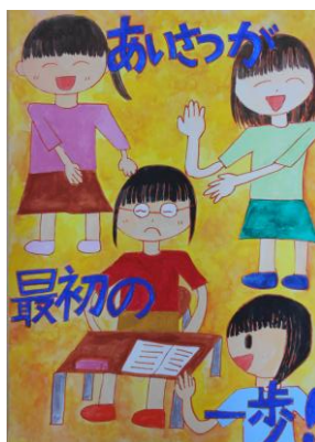
【ポスター部門】 優秀賞