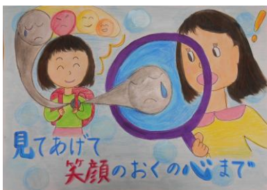
【ポスター部門】 最優秀賞