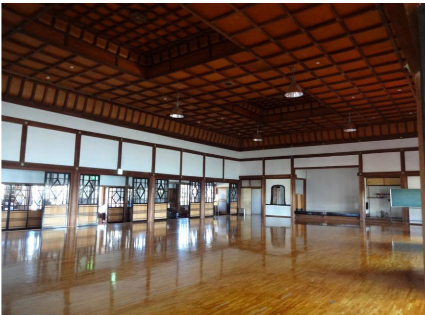
おりあげごうてんじょう 二重折上格天井