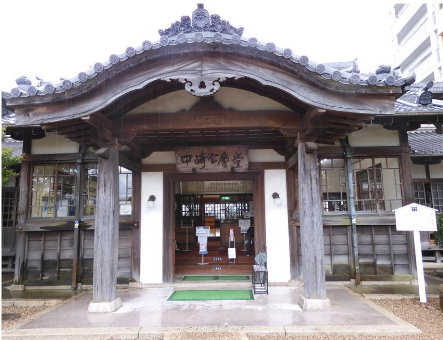
からはふ 唐破風玄関