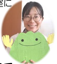
AFC やまて (保護者)

山手っ子たち、自分のペースで、あなたらしく成長して行って下さい。AFC やまて いつも応援しています。