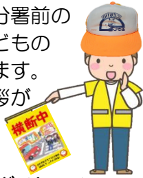
大久保ダイヤハイツ スクールガード

子どもたちの笑顔と元気な挨拶が何物にも代えがたい元気の源になっています。4月から新1年生を上級生と共に笑顔で元気よく安全に登校できるように見守ります。