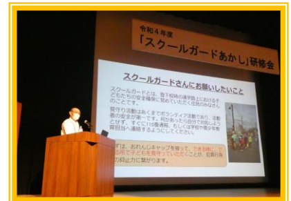
スクールガード・リーダーによる講話