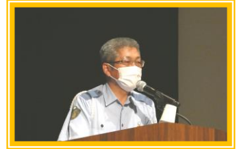
明石警察署による講演

スクールガード・リーダーによる講話では、活動にあたっての留意事項や不審者への対応についてアドバイスがありました。100名のスクールガードの方々にご参加いただき、充実した研修会となりました。