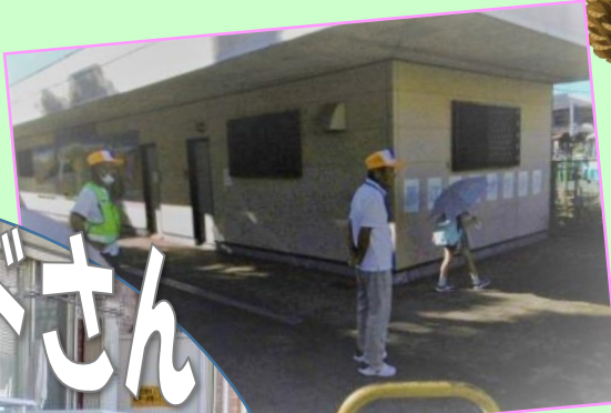
藤江駅北側 (オアシス前)