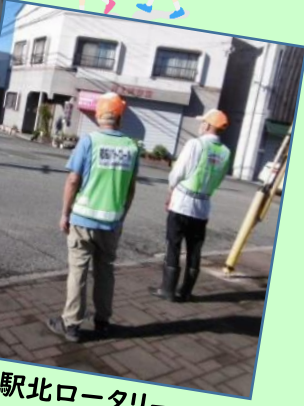
藤江駅北ロータリー