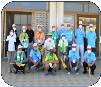
【林小スクールガード明石 2022】