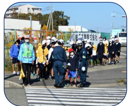
【川重への避難訓練誘導】