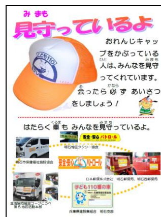
子どもの安全パンフレット