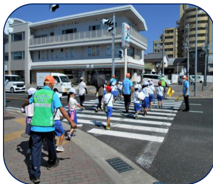
【まちたんけん見守り】