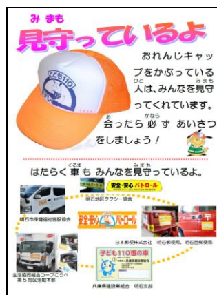
子どもの安全パンフレット