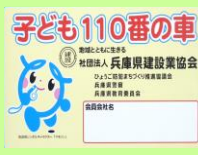
兵庫県建設業協会明石支部 子ども110番の車