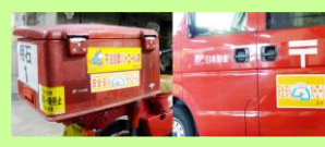
明石郵便局、明石西郵便局 安全・安心パトロール