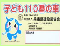
兵庫県建設業協会明石支部 子ども110番の車