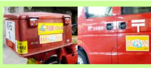
明石郵便局、明石西郵便局 安全・安心パトロール