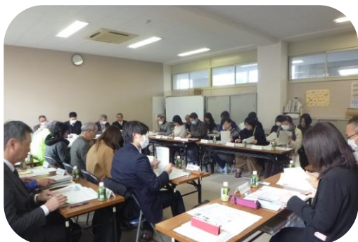
会議の様子（松が丘小）

1月21日～1月24日に、今年度第2回「明石市子どもの安全を守る地域連絡会議」を市内4つのブロックごとに開催され、各校区のスクールガード、PTA、学校長代表、警備会社、明石警察署、教育委員会、行政の代表が、地域の安全・安心の取り組みについて報告と情報や意見の交換を行いました。