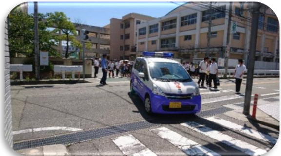
地域の青パト「花ちゃん号」

子どもたち一人ひとりの生命と人権を守る上で、スクールガードの皆様の見守り活動はなくてはならないものだと感謝しています。日々、子どもたちを優しく温かく見守っていただきありがとうございます。