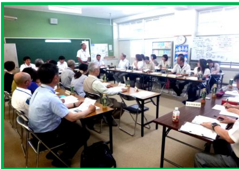
会議の様子(朝霧小学校)

6月24日から9月3日にかけて「明石市子どもの安全を守る地域連絡会議」を市内4ブロックにわかれて開催しました。スクールガード、PTA、学校長、警備会社、明石警察署、教育委員会、市の関係各課が、地域の安全・安心の取り組みについて報告と意見の交換を行いました。