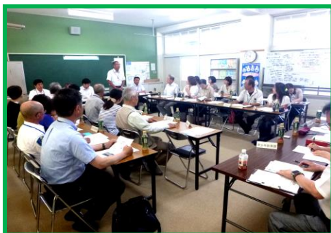
会議の様子 (朝霧小学校)

6月24日から9月3日にかけて「明石市子どもの安全を守る地域連絡会議」を市内4ブロックにわかれて開催しました。スクールガード、PTA、学校長、警備会社、明石警察署、教育委員会、市の関係各課が、地域の安全・安心の取り組みについて報告と意見の交換を行いました。