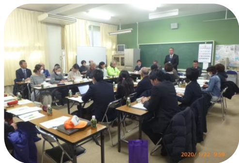
みんなで子どもの安全を守ります

1月22日から28日にかけて、第2回「明石市子どもの安全を守る地域連絡会議」を市内4つのブロックにわかれて開催し、各校区のスクールガード、PTA、学校長代表、警備会社、明石警察署、教育委員会、市の関係者が、地域の安全・安心の取り組みについて報告と、お互いに情報や意見を交換しました。