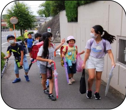
マスクをして登校