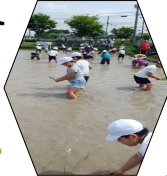
6月15日 田植え 楽しかった 5年生