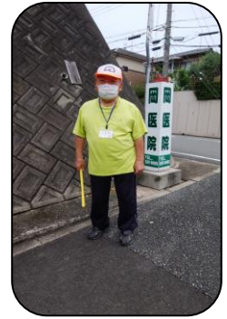
スクールガードさんも マスクをして見守り

新型コロナウイルス感染拡大感染予防のため、長い間休校が続きましたが、6月1日より検温、マスクをして登校が再開されました。子どもたちの楽しそうな様子に、私たちも元気をもらっています。