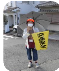
子どもたちの明るい挨拶が、今日の元気の基です。