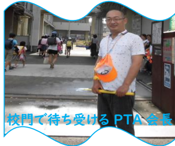
校門で待ち受ける PTA 会長