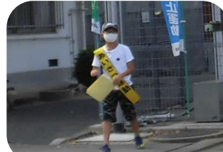
正門では児童代表もお迎えです。