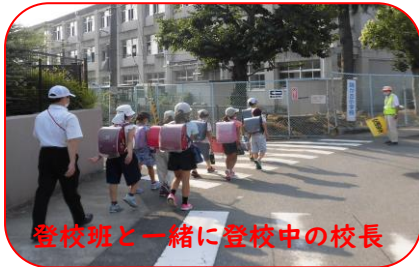
登校班と一緒に登校中の校長