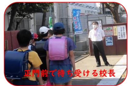
正門前で待ち受ける校長